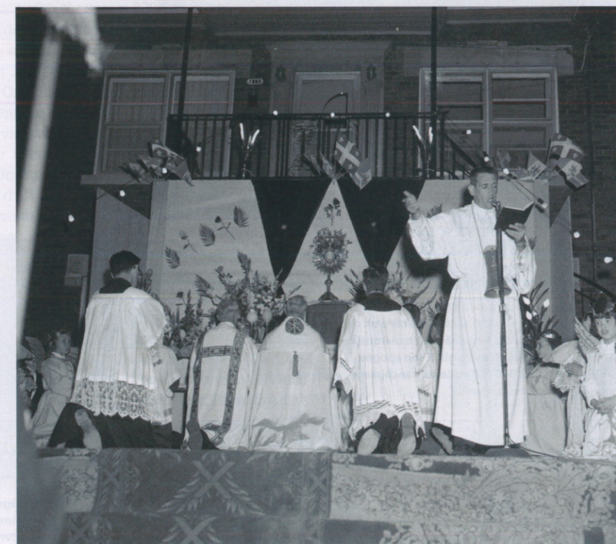
VERS 1953 , petits et grands se font un devoir de participer à la Fête-Dieu, 60 jours après Pâques. Des cortèges processionnent dans les rues et le parcours est ponctué d'arrêts à des autels improvisés comme celui-ci dans la Cité de Saint-Michel.