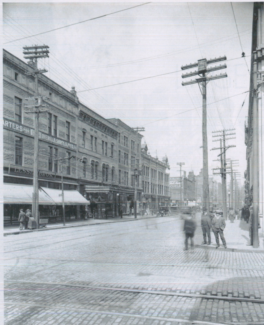
LE BOULEVARD SAINT-LAURENT , la Main, divise Montréal en deux: l'est et l'ouest. Tous les Montréalais le savent. Ce que beaucoup ne savent pas, c'est que c'est le résultat d'une décision de l'administration montréalaise datant de 1905.