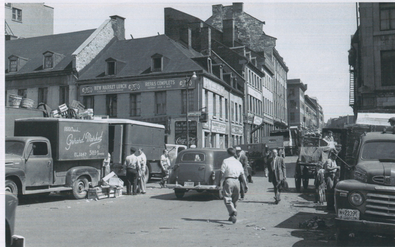
ENFANTS, HABITANTS, MARCHANDS ET TRAVAILLEURS circulent rue Saint-Paul (1952), véritable pôle au sein de la vieille ville — et première rue à bénéficier d'un éclairage public, dès 1815. Son croisement avec le Marché neuf — la place Jacques Cartier — n'y est pas étranger.

Avec le développement urbain, ces poches de pauvreté sont graduellement évacuées pour faire place, par exemple, à l'autoroute Ville-Marie. Dès 1954, le plan Dozois entraîne la démolition de tout un quadrilatère compris entre les rues Sanguinet, Saint-Dominique et Ontario, et les façades commerciales de la rue Sainte-Catherine, où l'on construit les premiers logements sociaux, les