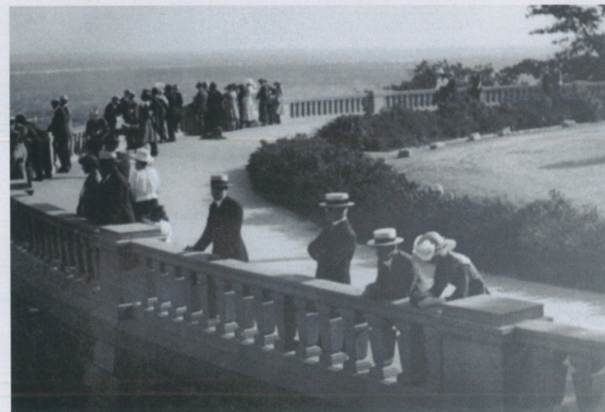
AU DÉBUT DES ANNÉES FOLLES , le belvédère du mont Royal est déjà un rendez-vous des Montréalais souhaitant contempler leur ville. Coiffés du canotier typique de l'époque, les messieurs accompagnent les dames pour cette activité dominicale.